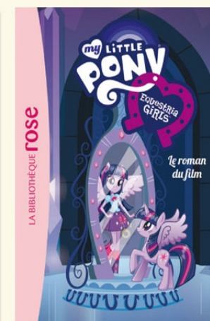
Le roman du film